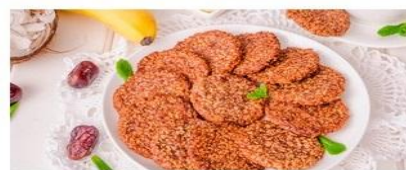
Постное кокосово-банановое печенье